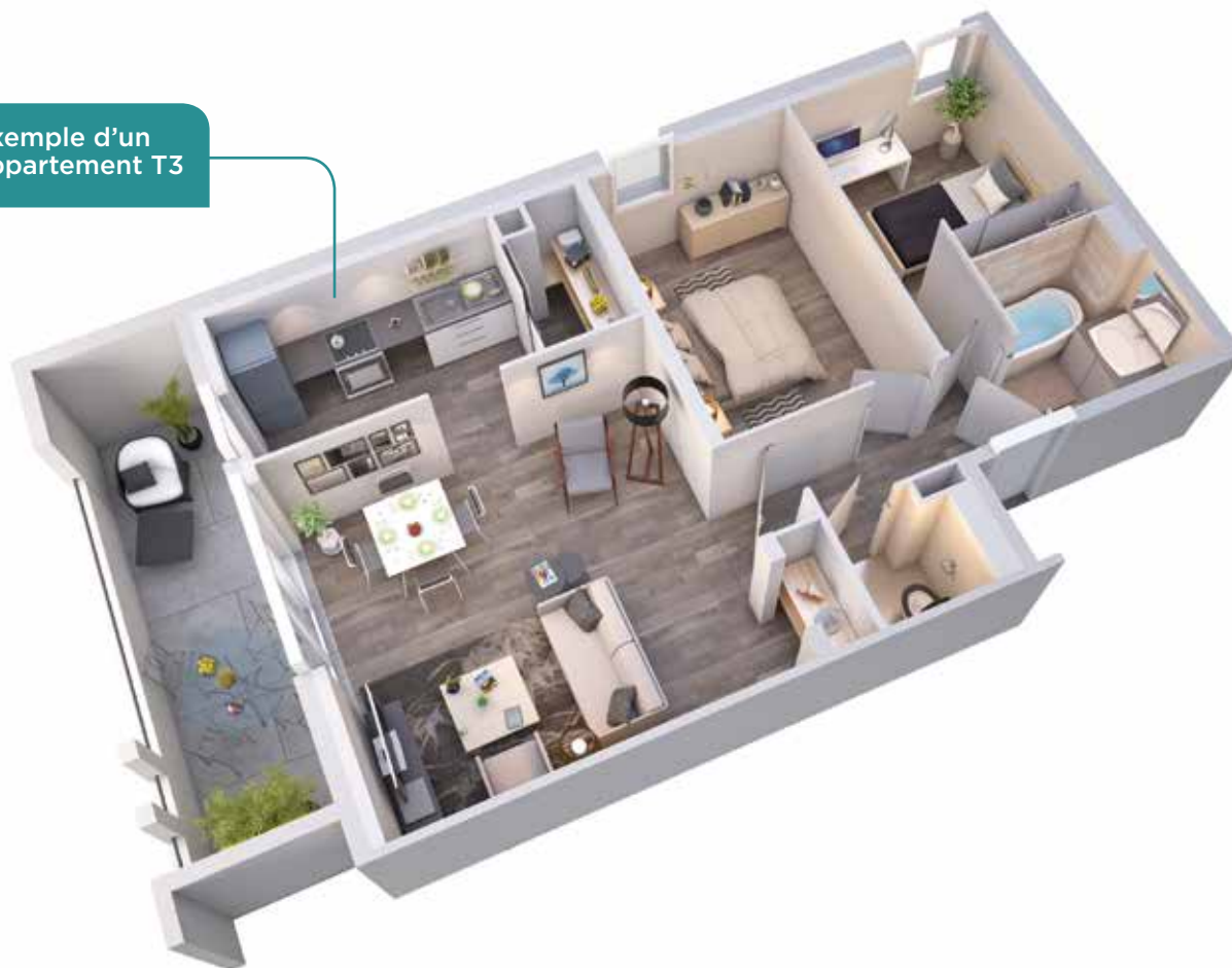
Exemple d'un appartement T3