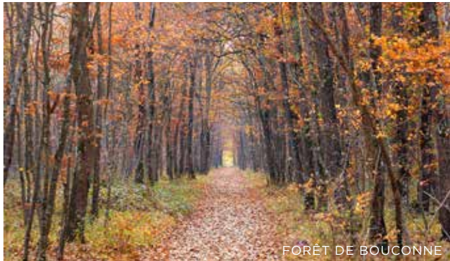
FORÊT DE BOUCONNE