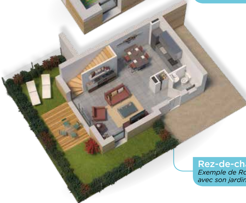
Rez-de-chaussée Exemple de Rdc d'une maison T3 avec son jardin et sa terrasse