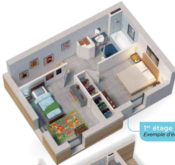
1 er étage Exemple d'étage d'une maison T3