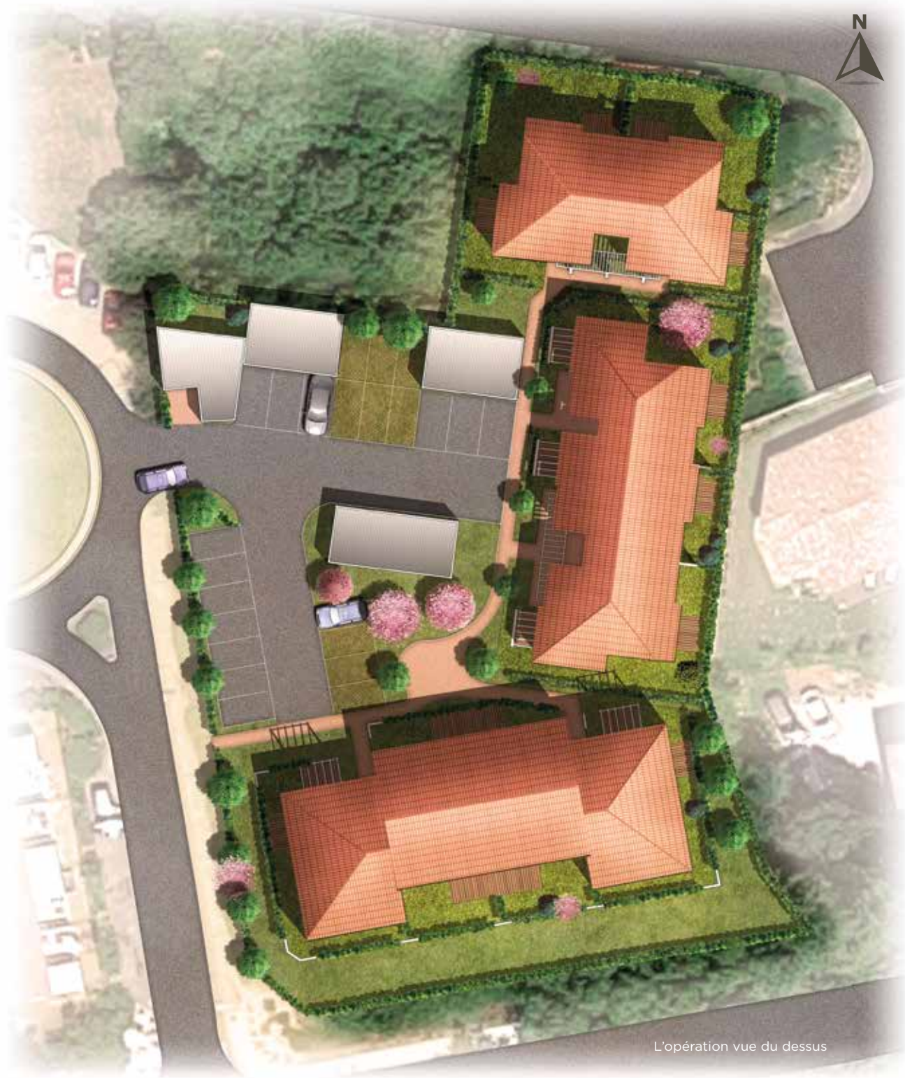
L'opération vue du dessus