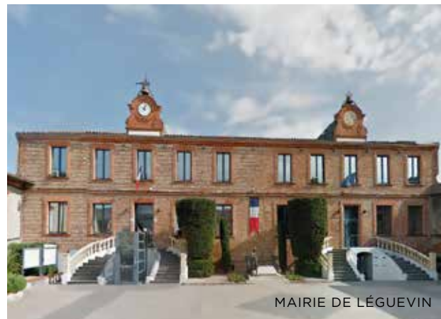
MAIRIE DE LÉGUEVIN