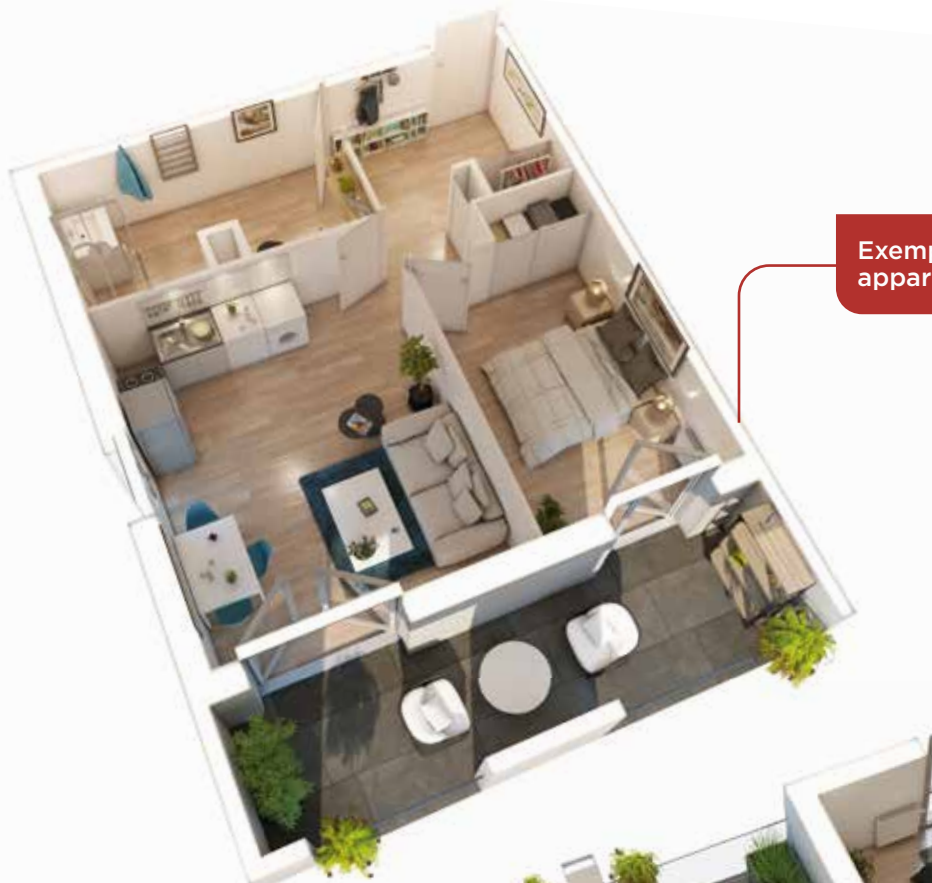
Exemple d'un appartement T2