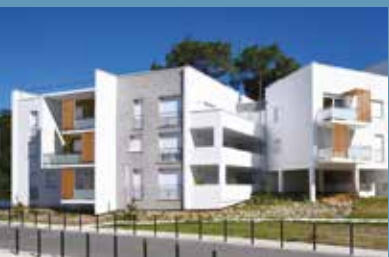
Le Clos des Vignes (33)