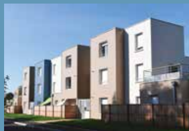
Le Pré de Rosette (24)