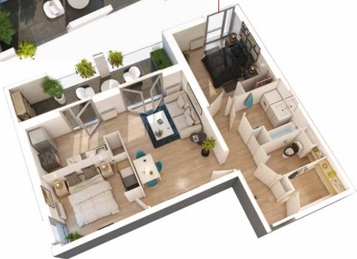
Exemple d'un appartement T3